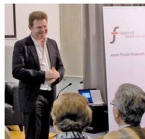
Buchpräsentation, Freud-Museum Berggasse

Michael wiederholt nun persönlich die Rituale, die er bei seinem Stellvertreter gesehen hat. Dabei erkennt er die Bedeutung seiner Symptome: Der Bluthochdruck signalisiert ihm, dass er zu viel Verantwortung für andere übernimmt und das Augenzucken hat es ihm ermöglicht klarer zu sehen, worum es geht. Er macht nicht mehr aus Rücksicht auf andere die Augen zu, sondern setzt klarere Grenzen, wenn ihm etwas zu viel wird. Das Gefühl der Wut, das er jetzt deutlicher wahrnehmen kann, weist ihn darauf hin, dass etwas gegen seinen Willen läuft und gibt ihm zugleich die Kraft zur Abgrenzung. Der Stellvertreter des Bluthochdrucks sagt: „Jetzt kann ich mich zurückziehen. Doch wenn Du nicht auf Dich selbst achtest, komme ich wieder, um Dich aufmerksam zu machen.“ Michael erkennt in dem Symptom ein Signal bzw. eine Art inneren Lehrmeister, der ihn auf Veränderungsbedarf aufmerksam macht.